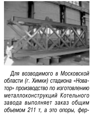
Для возводимого в Московской области (г. Химки) стадиона «Новатор» производство по изготовлению металлоконструкций Котельного завода выполняет заказ общим объемом 211 т, а это опоры, фермы, связи, прогоны, клювы, тросы и тяжи. В частности, на снимке - одна из четырнадцати опор, вес которой 5,5 т.