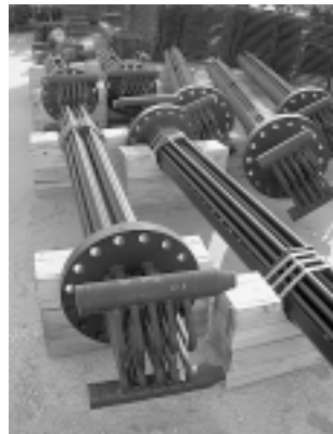
Упакованные перед отгрузкой заказчику выпущенные в ЗАО «Котельный завод «Белэнергомаш» запасные части к котельному оборудованию - трубные системы (составная часть регулятора перегрева).