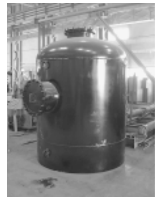
В черной глянцевитой покраске - камера выходная котла Г-420.