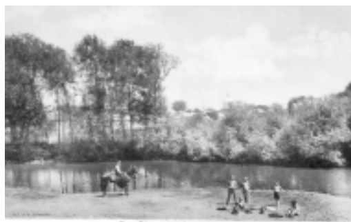
Fig. Strupac, Plo Beton

оружена крепость, - это вполне могла быть полуторатонная пищаль «Собака», отлитая из меди в 1572 году знаменитым пушечным мастером Андреем Чоховым - тем самым, что изготовил «Царь-пушку». Как сказано в старинных актах, громким выстрелом из этой пищали в