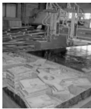
Установка термической резки листа фирмы «Messer» - замечательное подспорье производству ЗАО «Котельный завод «Белэнергомаш», с помощью которого с высокой производительностью изготавливаются детали всевозможной геометрии.

Катионит (смола ионообменная) будет выполнять ту же функцию, что и сульфоголь, который использовался прежде: очистка используемой воды от солей жесткости. В котельной четыре натрий-катионитовых фильтра, в три из них будет засыпан катионит, в один - сульфоголь. Заблаговременно в ходе монтажных работ по котельной были реконструированы все фильтры с применением новых фильтрующих элементов. Использование катионита и новых фильтрующих элементов позволит существенно экономить исходную сырую воду и соль.