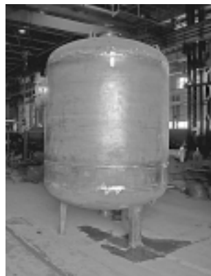
Расширитель к котлу КУ-125.