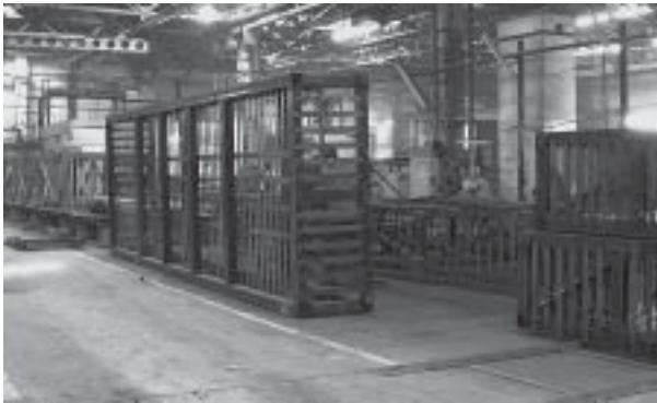
Заказ несложный, но довольно объемный - металлическая тара для изделий одного из предприятий города.