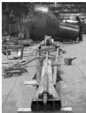
орган земснаряда - стрела, чей срочный ремонт новаторцы выполняли во второй декаде мая. На заднем плане - изготовление водонапорной башни объемом 10 м³.