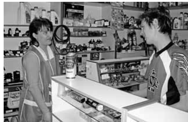
На снимке: покупатели бьются за разные, в различном настроении и состоянии, и со всеми важно уметь общаться.

Во всяком труде важно стремиться к постоянному совершенствованию. Наш магазин сопутствующих товаров при АЗС «ТНК» на компактной торговой площади постоянно увеличивает