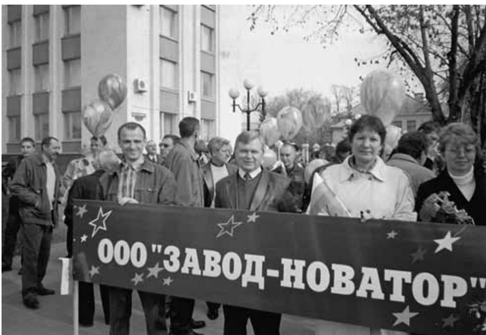
Фото Л. Регель и Д. Сиротенко, зав. отделением по защите экономических прав и интересов трудящихся БООП.

Рост заработной платы, увеличение численности работающих позволяет строить новые планы на будущее, жить с верой, что все будет складываться хорошо.