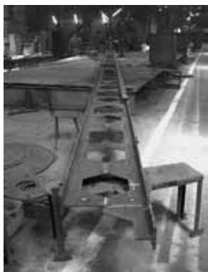
В сборочном цехе «Новатора» идет ремонт кран-балки для собственных нужд завода.