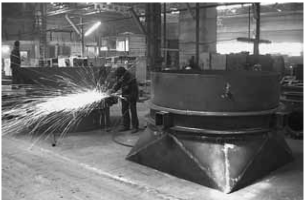
На двух снимках - металлоконструкции компенсаторов и переходников, масштабных деталей газопроводов.