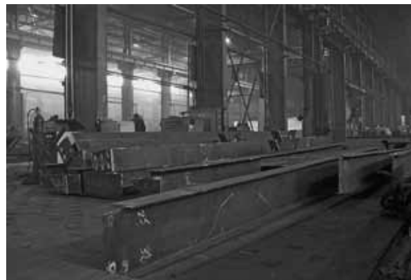
Детали строительных металлоконструкций, в большом объеме выпускаемые ООО «ОЭЗ «Белэнергомаш» по заказу одного из предприятий добывающей промышленности.