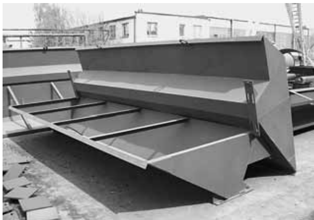
Ковши-карбофилы для очистки свиноферм, которые ООО «Завод-Новатор» изготавливает нескольких типоразмеров в большом количестве, лоснятся свежим грунтом.